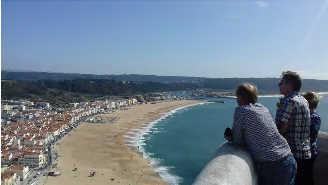
Nazaré on huikeiden näköalojen ja herkullisten kalaruokien paikkakunta Atlantin rannalla.